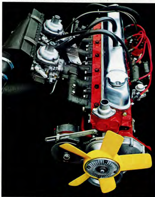
B 30. 3 liters, 6-cylindrig. 145 hk SAE. Avgasrening som standard.