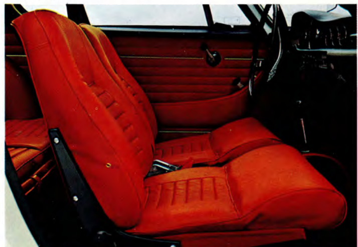
Volvo 1800 S