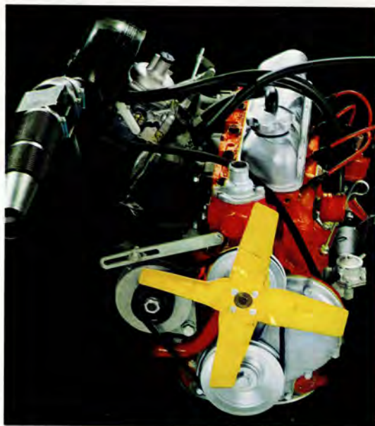
B 20 A. 2 liters, 4-cylindrig. 90 hk SAE. Avgasrening som standard.

Volvos kvalitet och slitstyrka bidrar till låga bilkostnader och högt andrahandsvärde. Dessutom har Volvo 164, 140-serien och Amazonmodellerna Volvos 5-åriga PV-garanti — ingen extra kostnad för vagnskadeförsäkring. Alla Volvo-ägare har dessutom tillgång till speciella försäkringsförmåner genom Volvia, Volvos eget försäkringsbolag.