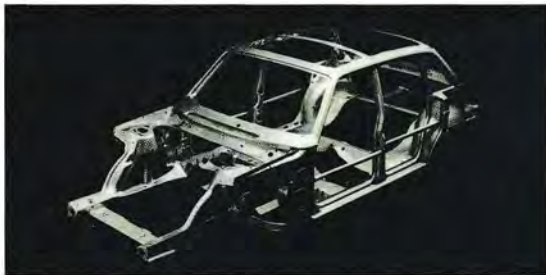
Förare och passagerare skyddas av en pålitlig säkerhetsbur.

Volvo har genom åren lagt ned ett betydande arbete på att öka säkerheten för bilförare och passagerare. Många säkerhetsdetaljer, som Volvo introducerat, har t.o.m. föregripit lagstiftningen. Samtliga Volvos bilmodeller är konstruerade för att ge högsta tänkbara säkerhet samtidigt som de ger ett långtgående skydd mot skador.