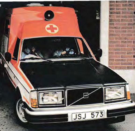
Volvo Ambulans är lättmanövrerad – även i trånga passager.