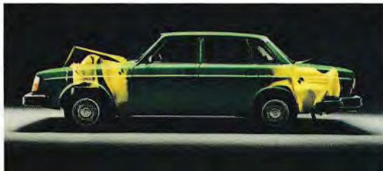
De främre och bakre partierna har energiupptagande deformationszoner.

En Volvo har konstruerats med utgångspunkt från hur stora påfrestningar människokroppen tål vid en kollision, och för att ge förare och passagerare en så mjuk "inbromsning" som möjligt.