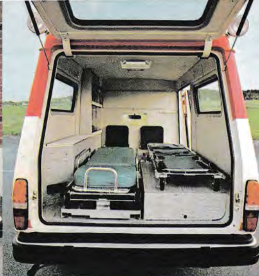
Det är gott om utrymme för vårdpersonalen, som dessutom har sjukvårdsutrustningen lätt åtkomlig.