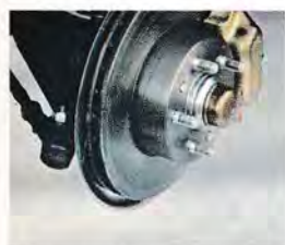
Volvo erbjuder ett av marknadens mest pålitliga bromssystem.