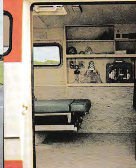
Volvo Ambulans har en bred och hög dörr på höger sida. Detta underlättar in- och urstigning för vårdpersonalen och rörelsehindrade personer, samtidigt som dörren kan tjänstgöra som reservutgång för bären i den händelse ambulansen skulle bli påkörd bakifrån! En viktig säkerhetsdetalj som Volvo Ambulans är ensam om! Vårdutrymmet är vidare försett med en rejäl taklucka.