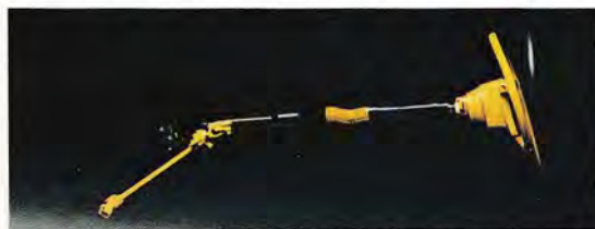
Vid en kollision ger Volvos ratt 5-dubbel säkerhet.

En Volvo har konstruerats med utgångspunkt från hur stora påfrestningar människokroppen tål vid en kollision, och för att ge förare och passagerare en så mjuk "inbromsning" som möjligt.