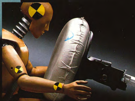
Airbag finns som tillbehör.