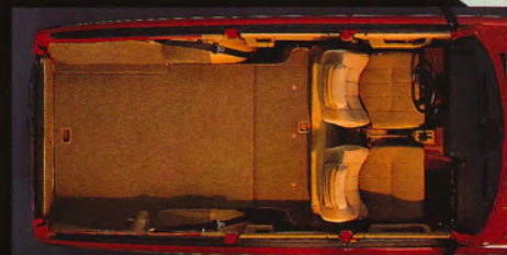
Lastutrymme för över två kubikmeter last.