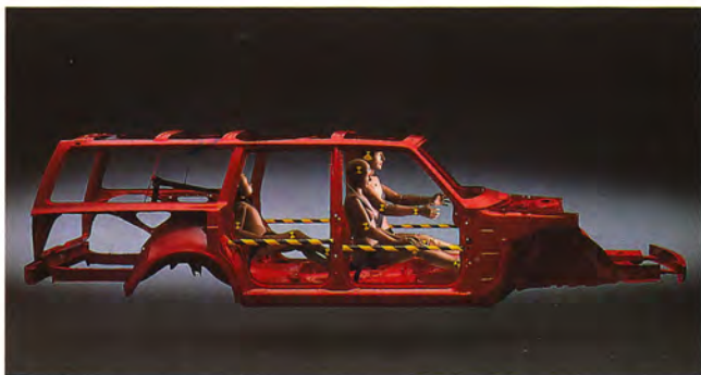
I herrgårdsvagnens säkerhetsbur sitter föraren och passagerarna lika säkert som i sedanens.