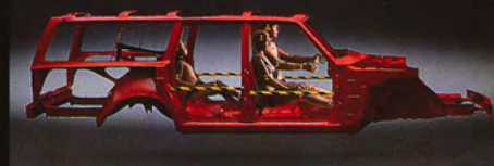
Säkerhetsburen - lika stark i herrgårdsvagnen.