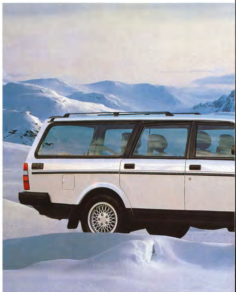
Både som sedan och som herrgårdsvagn finns Volvo 240 i två varianter,

Välkommen i klubben, du som prioriterar på samma sätt. Och välkommen att provköra den bil som förra året utsågs till "Bästa Köp" i den amerikanska konsumentguiden "The Complete Car Cost Guide".