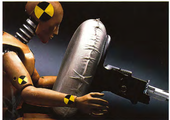
Airbag finns som fabriksmonterad extrautrustning för föraren.

Som fabriksmonterad extrautrustning finns airbag för föraren.