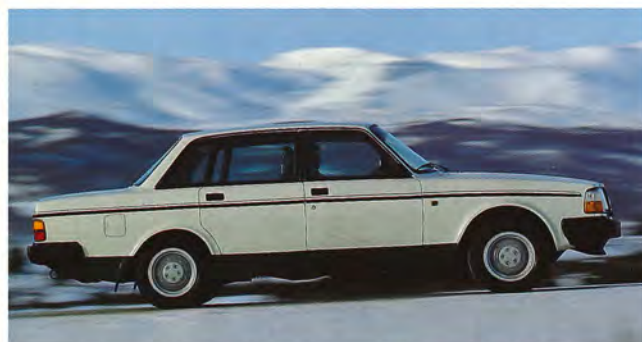
Bakom ratten gläds du åt den goda segdragningsförmågan, den exakta styrningen och det konsekventa uppträdandet.

Köregenskaperna är en av anledningarna. Styrsystemet och hjulupphängningen är konstruerade så att föraren slipper obehagliga överraskningar. Och i Volvo-stolens komfort kan koncentrationen hållas