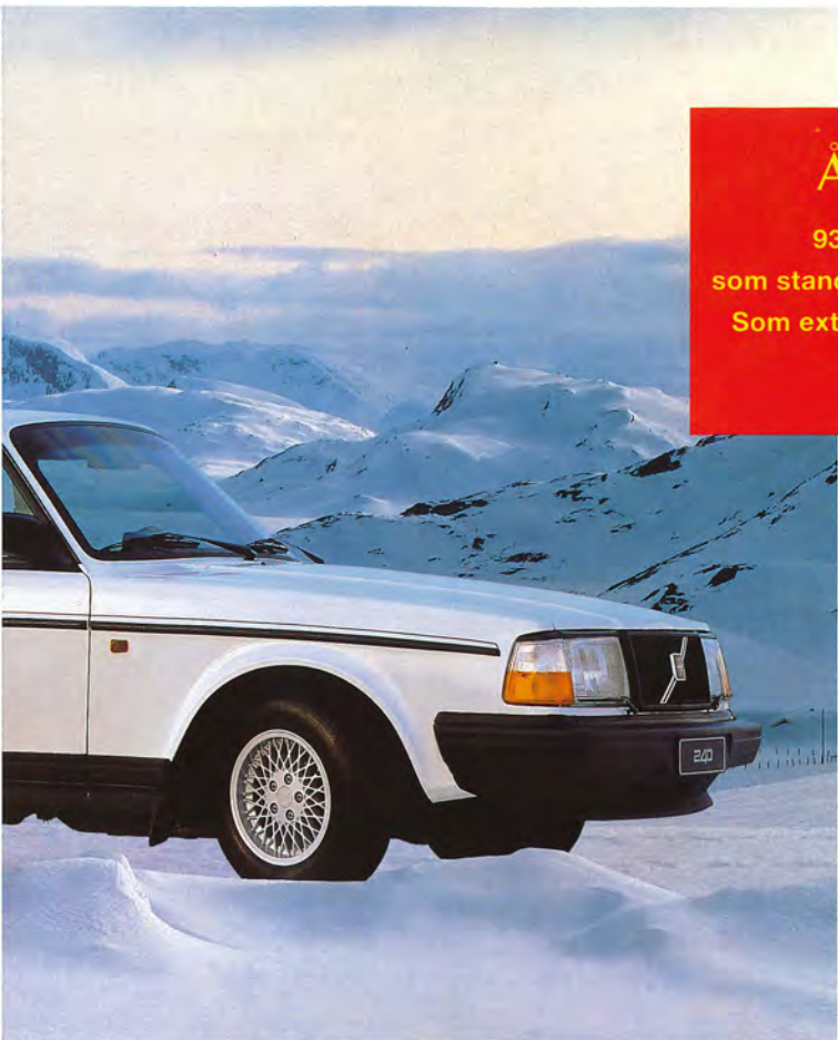
GL och SE.