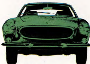
Volvo 1800 E 2-dörrars, 135 hk SAE, elektronikstyrd bränsleinsprutning