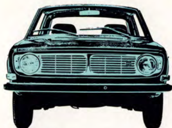
Volvo 142 2-dörrars, 90 hk SAE