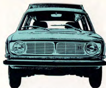
Volvo 145 Express 5-dörrars, 90 hk SAE