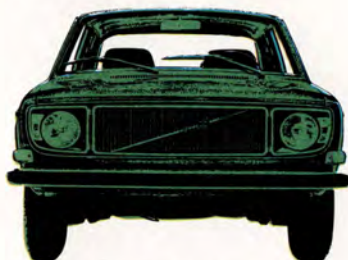
Volvo 144 de Luxe 4-dörrars, 90 eller 110 hk SAE