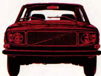
Volvo 142 de Luxe 2-dörrars, 90 eller 110 hk SAE