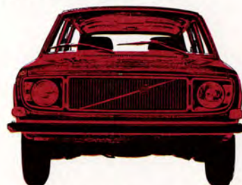
Volvo 145 de Luxe 5-dörrars, 110 hk SAE