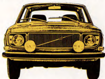
Volvo 142 Grand Luxe 2-dörrars, 135 hk SAE, elektronikstyrd bränsleinsprutning