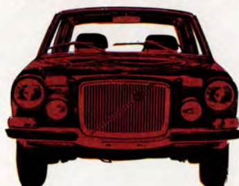
Volvo 164 4-dörrars, 145 hk SAE