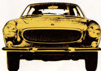
Volvo 1800 ES 3-dörrars, 135 hk SAE, elektronikstyrd bränsleinsprutning