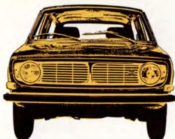
Volvo 145 Herrgårdsvagn 5-dörrars, 90 hk SAE