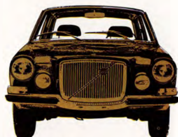
Volvo 164 E 4-dörrars, 175 hk SAE, elektronikstyrd bränsleinsprutning