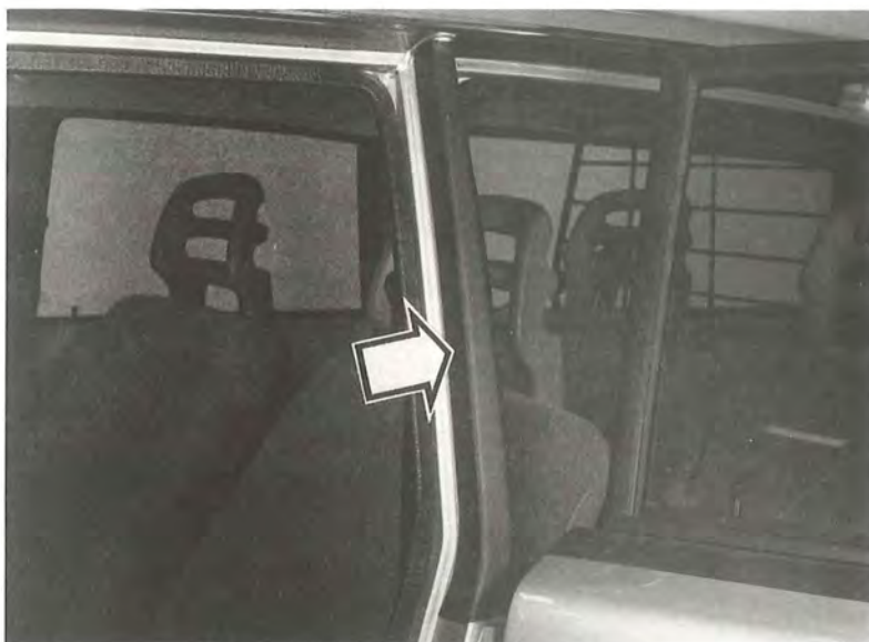
Tejp på B-stolpe

När tejpens sitter korrekt, pressa ur vatten och luftblåsor med en gummispäckel så tejpens ligger slätt.