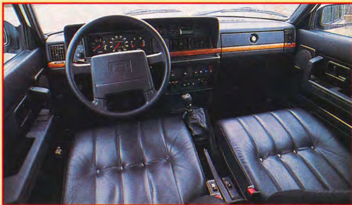
Med hjälp av läderklädsel à 7.500 kronor och tränlägg känns 245-an inbjudande. Men visst märks det att instrumentering och reglage härstammar från 70-talet.