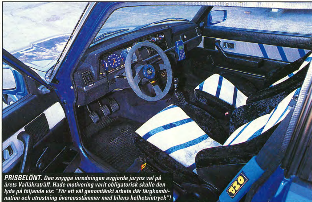
PRISBELÖNT. Den snygga inredningen avgjorde juryns val på årets Vallåkraträff. Hade motivering varit obligatorisk skulle den lyda på följande vis: "För ett väl genomtänkt arbete där färgkombination och utrustning överensstämmer med bilens helhetsintryck!"

Se upp för en norsk Volvo med huven öppen på träffarna nästa år! □