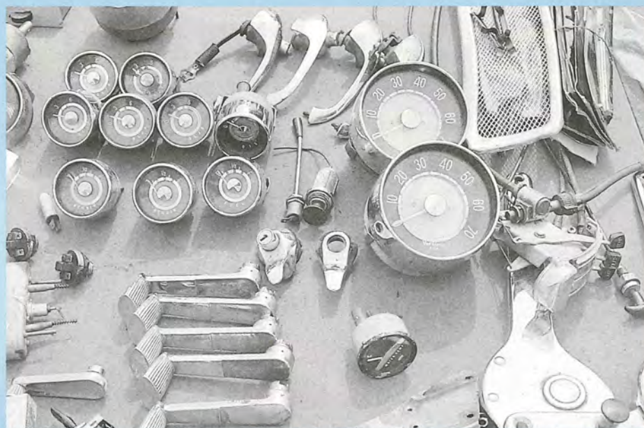
För dem som hade ett renoveringsprojekt på gång, fanns de flesta delar att hitta på marknaden utefter depågatan.