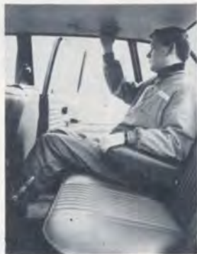
I jämförelse med Amazon – som toppar statistiken – är 144:an betydligt rymligare och ger framför allt baksättespassagerarna komfortablare åktur.

Årets bil förra året – Volvo 144 – slog an på bilköparna. Ligger redan fyra i registreringsstatistiken trots det relativt höga priset, 19 600 kr.