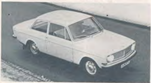
Stora Volvos tvådörrarsversion med 115 hästar och två färgsare har en del sportiga tendenser, men också en del irriterande smärfel.