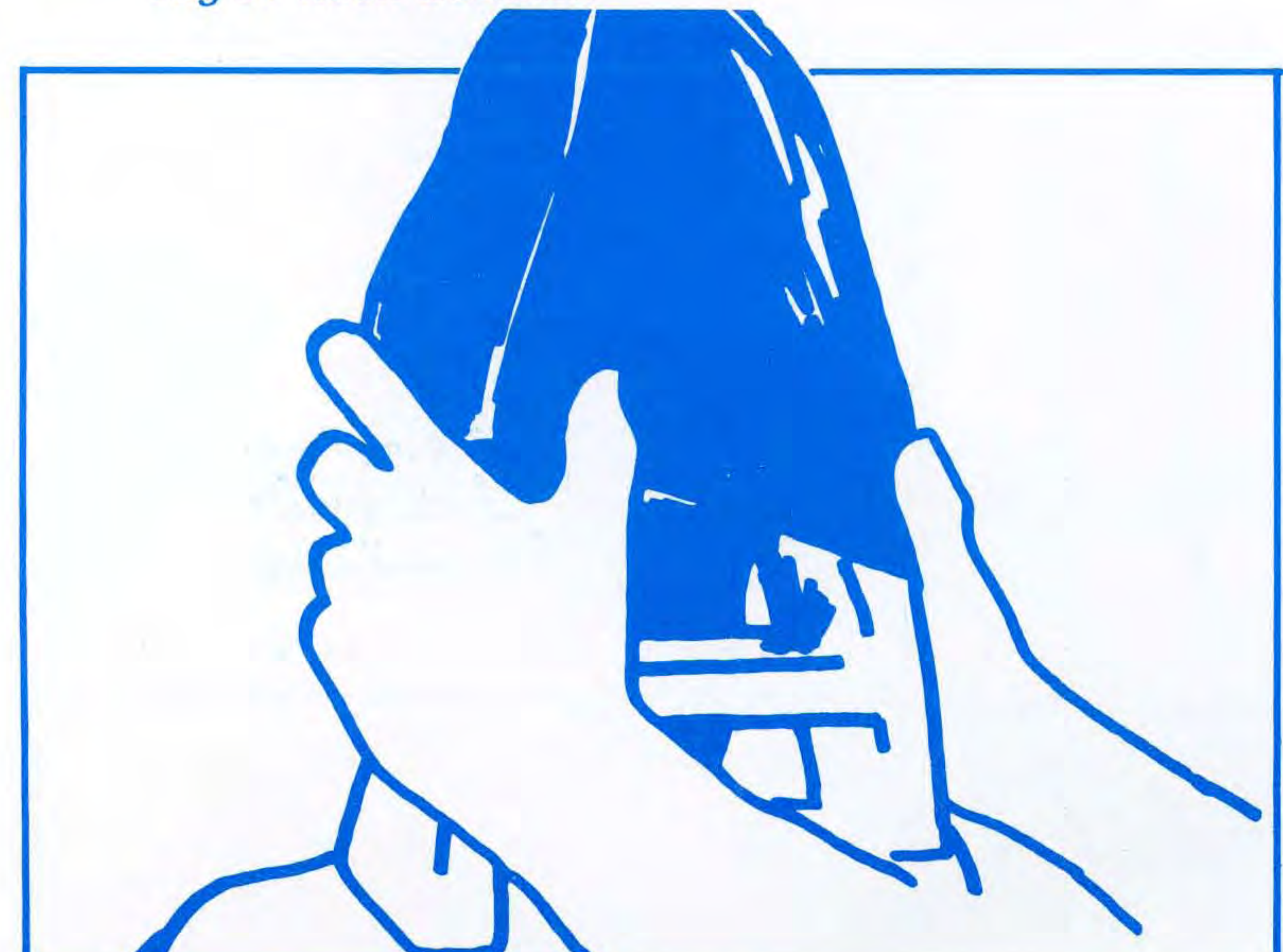
Remove the head restraint cover.

Sätt in förbandsförpackningen från baksidan i främre nackskyddet.