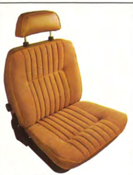
Beige 2) 4)