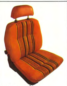
Röd rand 2)