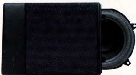
HT 228/25 W. 6" Dubbelkonhögtalare till framdörr.