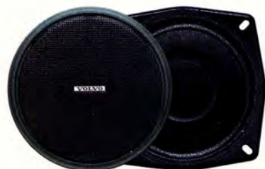
3436766-4/25 W. Dubbelkonhögtalare till framdörr.