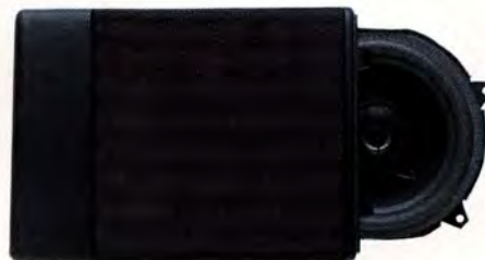
HT 229/30 W. 6" Koaxialhögtalare till framdörr.