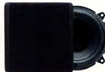
HT 230/25 W. 5" Dubbelkonhögtalare till baddörr.