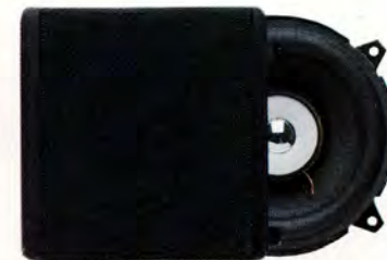
HT 231/30 W. 5" Koaxialhögtalare till baddörr.