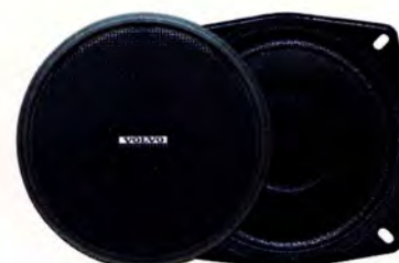
3436768-0/25 W. Dubbelkonhögtalare till hatthylla.

Förstärkare HA 4520 , max. effekt 4 x 20 W samt Equalizer 6117 , passar även till Volvo 440.