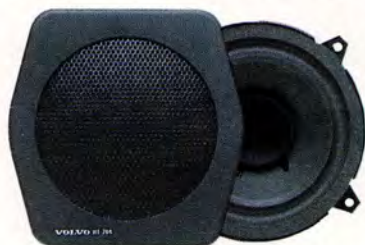
HT 204/25 W. 5" Dubbelkonhögtalare till framdörr.