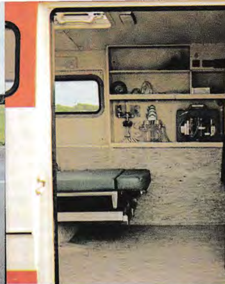
Volvo Ambulans har en bred och hög dörr på höger sida. Detta underlättar in- och urstigning för vårdpersonalen och rörelsehindrade personer, samtidigt som dörren kan tjänstgöra som reservutgång för bären i den händelse ambulansen skulle bli påkörd bakifrån! En viktig säkerhetsdetalj som Volvo Ambulans är ensam om! Vårdutrymmet är vidare försett med en rejäl taklucka.