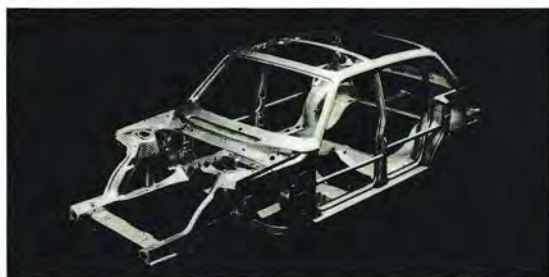
Förare och passagerare skyddas av en pålitlig säkerhetsbur.

Volvo har genom åren lagt ned ett betydande arbete på att öka säkerheten för bilförare och passagerare. Många säkerhetsdetaljer, som Volvo introducerat, har t.o.m. föregripit lagstiftningen. Samtliga Volvos bilmodeller är konstruerade för att ge högsta tänkbara säkerhet samtidigt som de ger ett långtgående skydd mot skador.