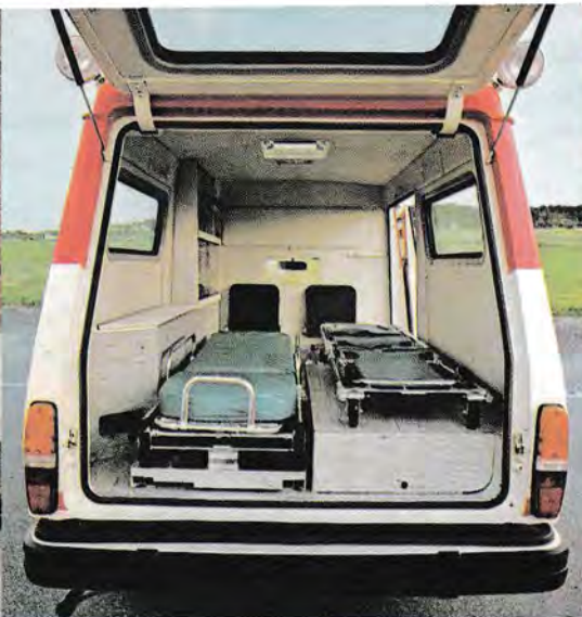
Det är gott om utrymme för vårdpersonalen, som dessutom har sjukvårdsutrustningen lätt åtkomlig.