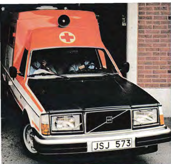
Volvo Ambulans är lättmanövrerad – även i trånga passager.