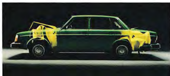
De främre och bakre partierna har energiupptagande deformationszoner.

En Volvo har konstruerats med utgångspunkt från hur stora påfrestningar människokroppen tål vid en kollision, och för att ge förare och passagerare en så mjuk "inbromsning" som möjligt.