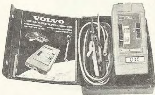
Multimeter 999 6525-3

Extra bruksanvisning beställningsnr TP 23036.