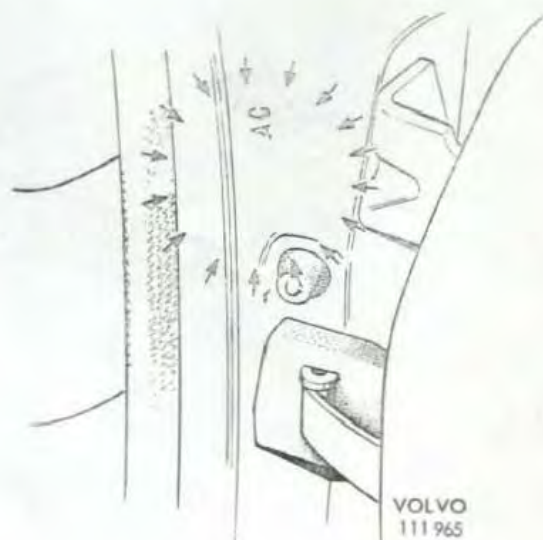
Bild 1. 140 och 164 t.o.m. 1972 års modell, höger A-stolpe. Kodbeteckningen finns inom det markerade området.

Placeringen av kodbeteckningen på 140 och 164 visas i bild 1 och 2 och på 1800 i bild 3.