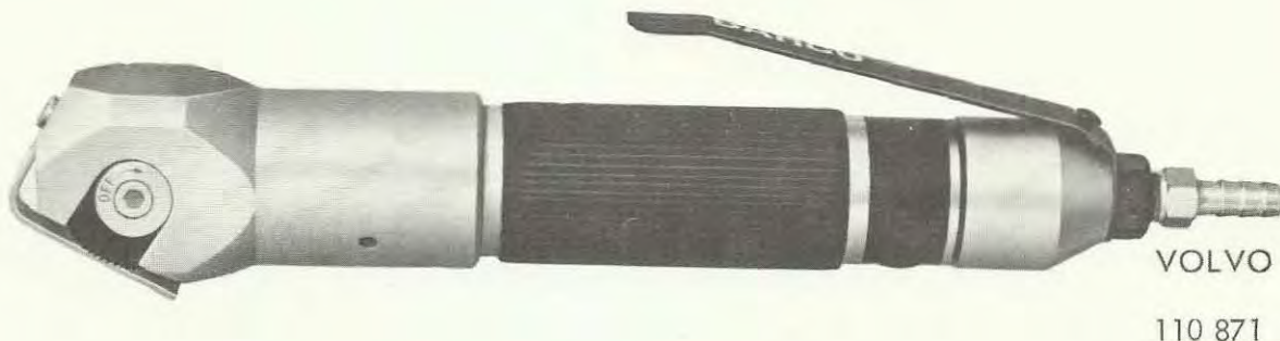
Bild 1. Plåtsåg Bacho typ PS-12

Sågen är liten (bilden i skala 1:2) och lätt att arbeta med. Den har en stödplåt (B) som kan ställas in för olika plåttjocklekar, se bild 2. Även ansättning en framgår av bild 2.