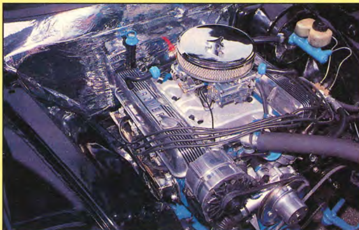
Rover V8:an fick glasblästrade toppar, som dessutom är planade 0,20" med inslipade ventiler. Bobby byggde rostfritt avgassystem med kromdämpare.

— Ja, jag hade nämligen gjort ögonlock på strålkastarna!