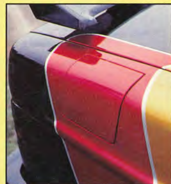
Tanklockets placering ger det mäsvinge-look vid öppning.