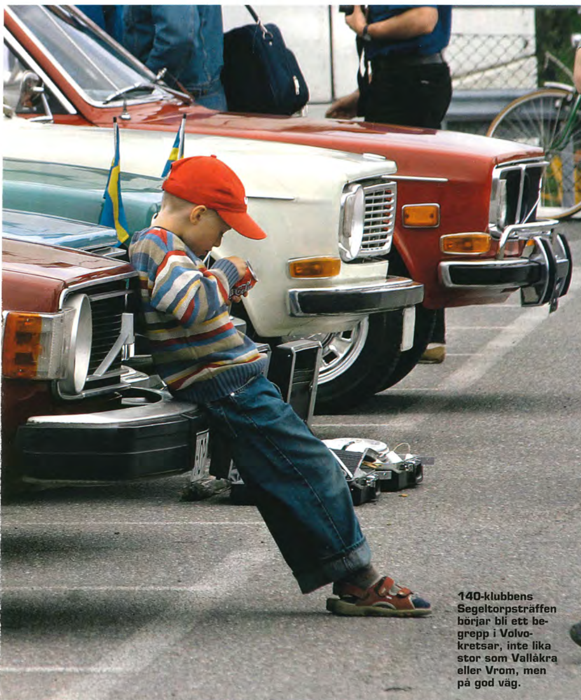
140-klubbens Segeltorpsträffen börjar bli ett begrepp i Volvo-kretsar, inte lika stor som Vallåkra eller Vrom, men på god väg.