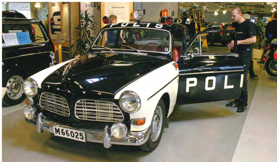
Statspolisen, länstrafikgruppen och trafikpolisen. Alla älskade Amazon. Landets sista polis-Amaزون tjänstgjorde hos LTG i Helsingborg mellan 1970 och 1973, den är bland annat utrustad med Fujica Drive i framrutan, röda saftblandare på taket och specialsydd galonklädsel.