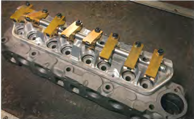
Det här är riktiga grejor! KG rekommenderar rullvippor och heltänkande vipparmsbrygga som eliminerar svikt i vipparmsaxeln. Läckert och mycket effektivt.

► körbarheten och vridmomentet betydligt bättre, intygar KG.