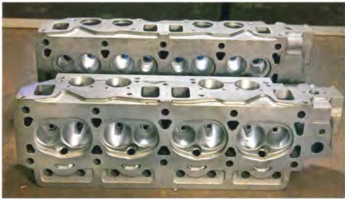
Titta, njut och jämför. Närmast en extrem så kallad Steg 6-topp med flyttade, uträtade och optimalt bearbetade kanaler. I bakgrunden en originaltopp. Steg 6:an är inte till salu!