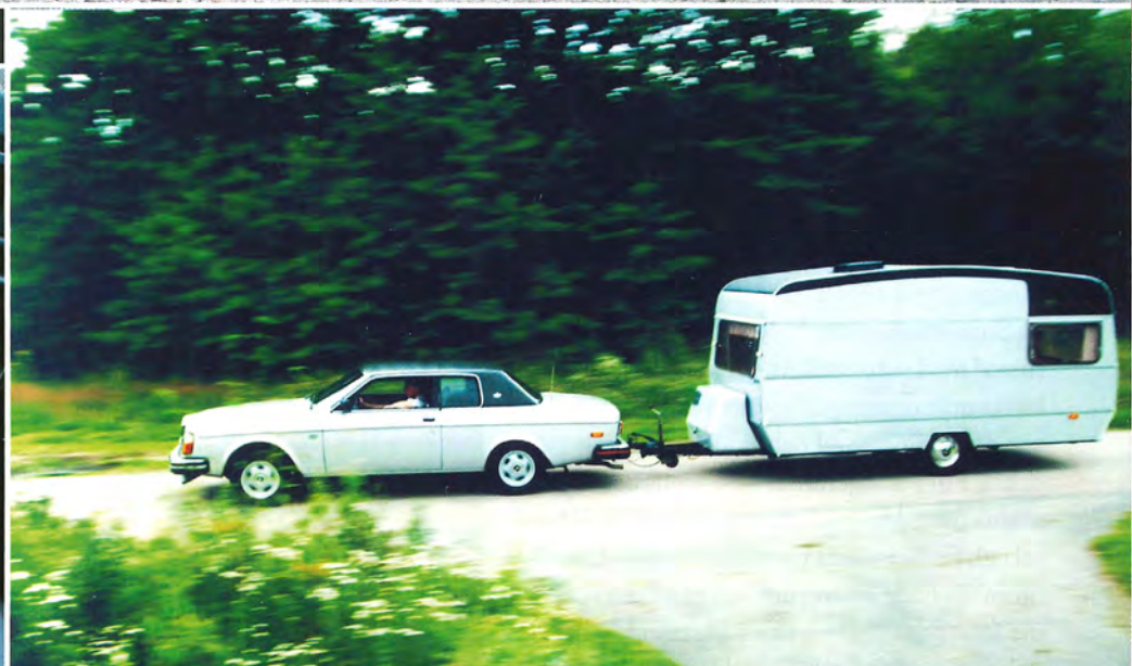
Observera den väl genomtänka formen på husvagnens vinyltak.