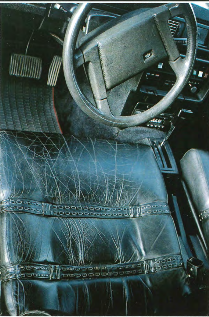
De flätade banden på sitsen ser eleganta ut.

Lättmetallfälgarna är av äldre modell. De måste vaxas regelbundet för att behålla fräschören. Årsmodell 1978 tillverkades i 2 120 exemplar. Samtliga med silvermetalllack och svart vinyltak.