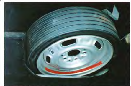
Reservhjulet av space-saver-typ. Kompressorn saknas.