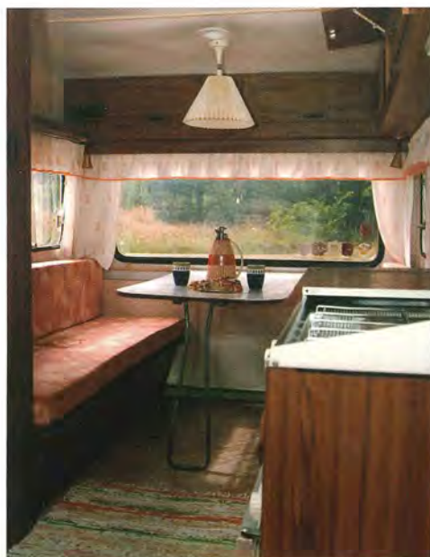
Den rosa tonen sprider ett romantiskt skimmer i husvagnen. ▶