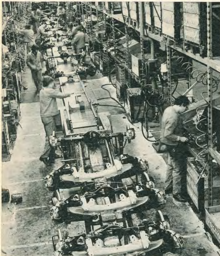
Vid förmonteringsbanor färdigställs komponenterna till bilen. Här är det hjulaxlar som monteras.

I samband med invigningen av Volvos fabrik i Gent deltog prins Bertil och Volvos styrelse jämte belgiska ministrar och företrädare för lokala myndigheter.