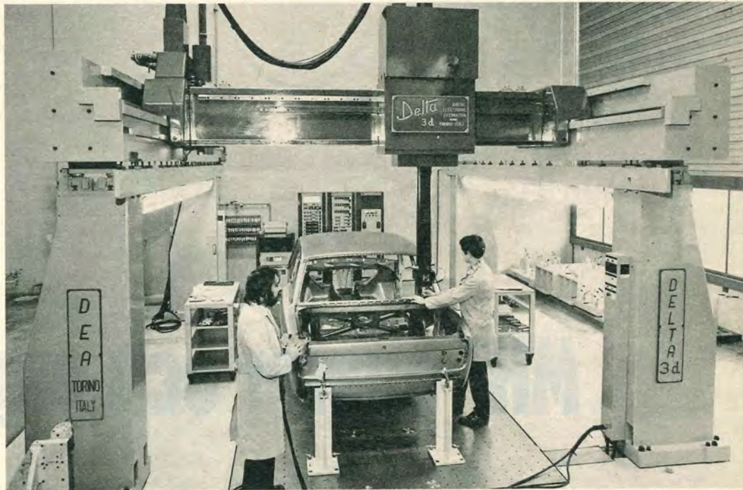
Till kontrollfinesserna i Volvos fabrik i Gent hör denna numeriskt styrda apparatur för kontinuerlig kontroll av karossernas form och yta.

Det är mot denna bakgrund av siffror man skall se utbyggnaden i Gent. I ett andra expansionssteg kan produktionen ökas till 100 000 enheter. När det gäller lastbilsproduktionen i Alseberg är kapacitetstaket uppnått och Volvochefen förutsade en snar ökning av produktionsresurserna där.