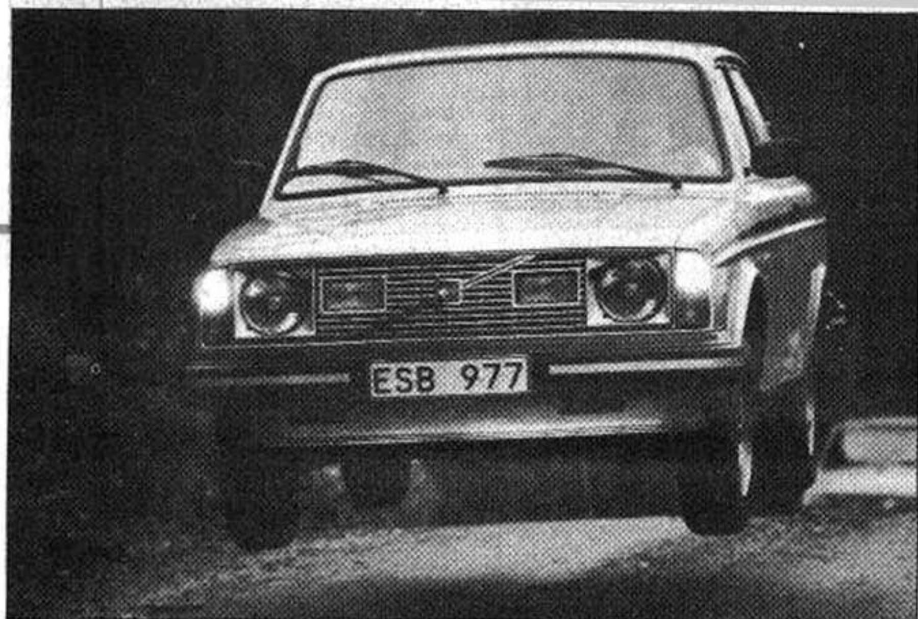
Bilen hoppar fint — går verkligen bra på dåligt underlag.

och detta bidrar också till att göra bilen mindre överstyrd.