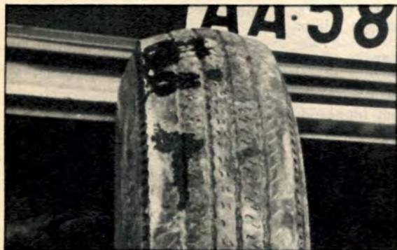
Så här nedslitna var två av de fem däck som ingick i Volvos utrustning, vilket knappast är acceptabelt på en så dyr vagn.