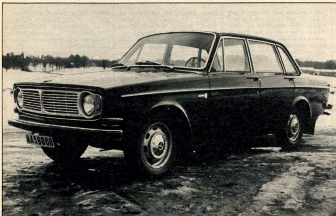
Testvagnens lackering var synnerligen väl bibehållen, och inte heller när det gällde de blanka delarna fanns något att anmärka på. Vilket tyder på att förre ägaren varit noga med att hålla bilen ren.