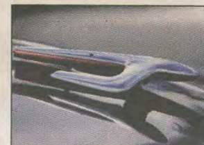
Huvkråka Volvo PV 444