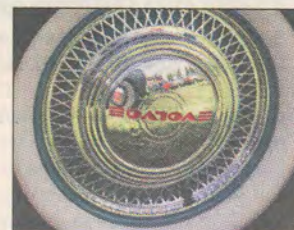
En äkta fälg.